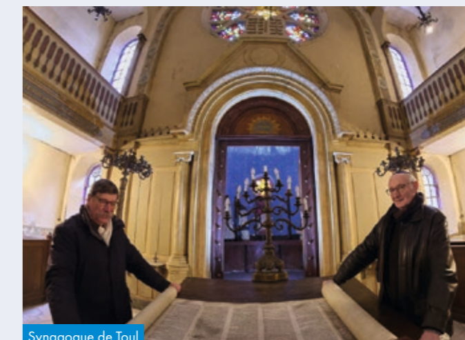
Synagogue de Toul

Ce programme illustre une dynamique nationale de sauvegarde d'un patrimoine fragile, tout en favorisant sa transmission au public. Un nouvel appel à projets est ouvert jusqu'en septembre 2026.