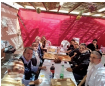
Repas dans la soucca avec les responsables consistoire