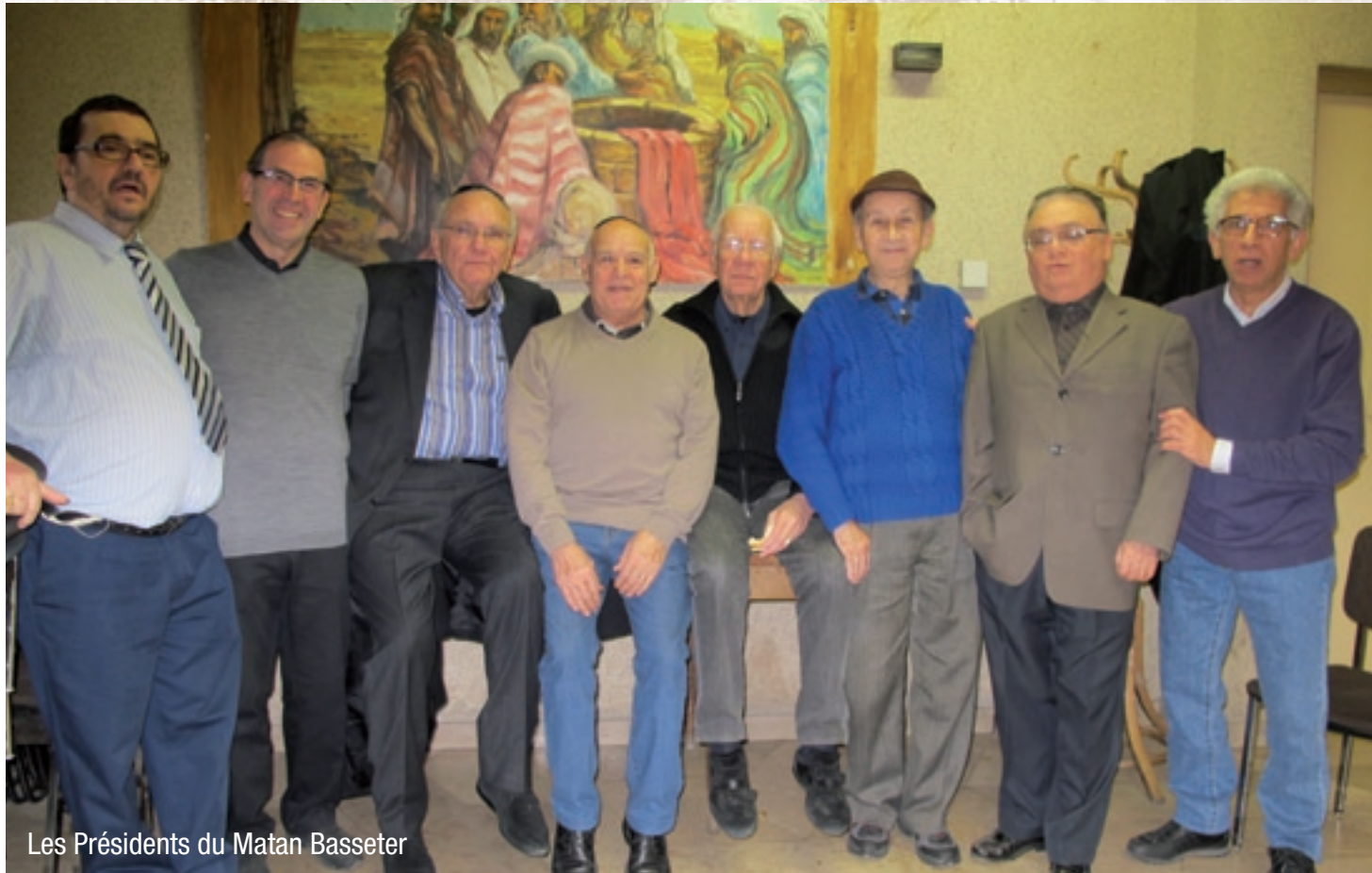
Les Présidents du Matan Basseter

Ne manquons pas de remercier chaleureusement tous ces présidents qui ont pu accomplir un travail extraordinaire, sans compter leur temps, et toujours au service des plus démunis et toujours là pour aider les personnes âgées.