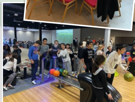
Bowling du 31 octobre