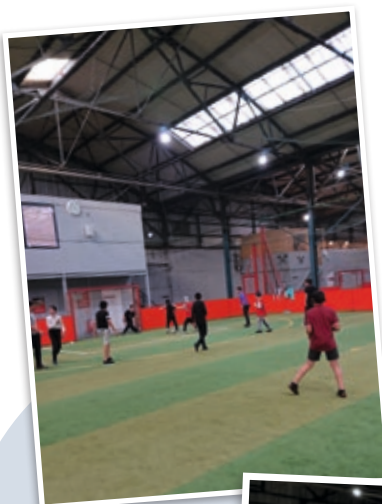
Foot en salle