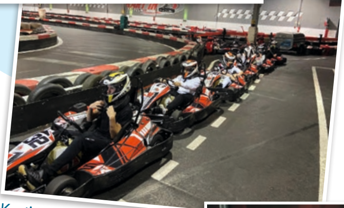
Karting 31 octobre