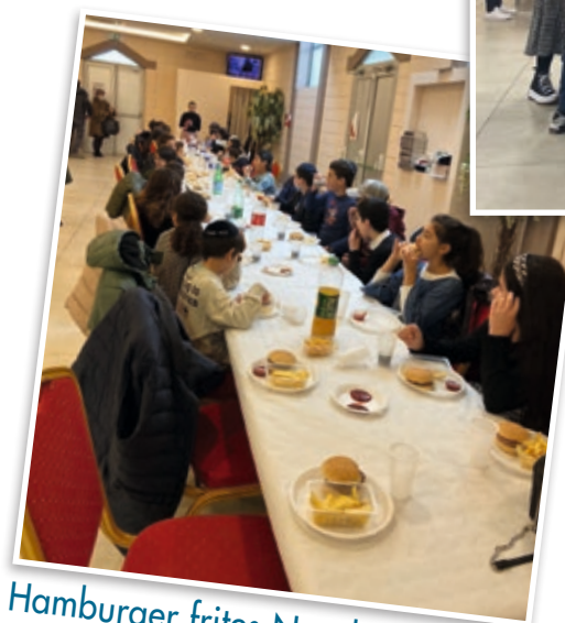
Hamburger frites Neveh