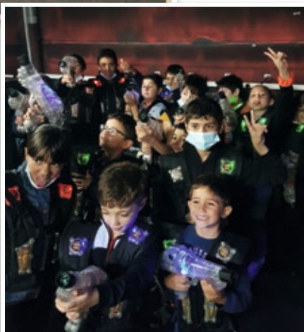
Activité star laser