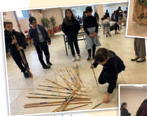
Activité jeu de bois