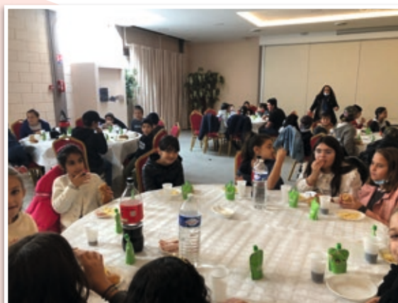
Repas pour sortie cirque