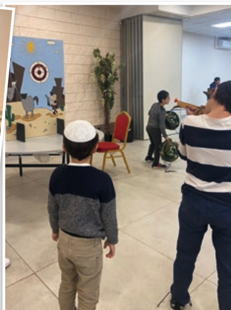
Jeu de fléchettes