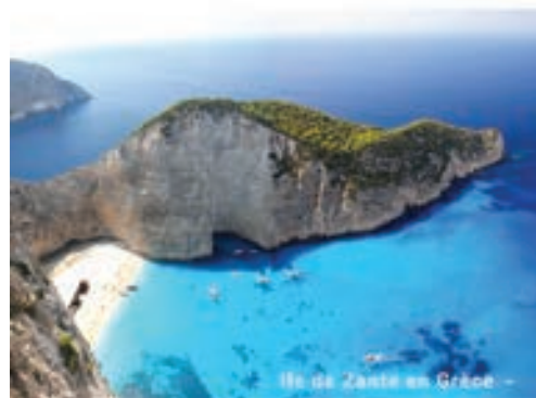
Ile de Zante en Grèce -