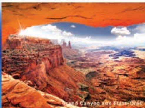
Grand Canyon aux Etats-Unis