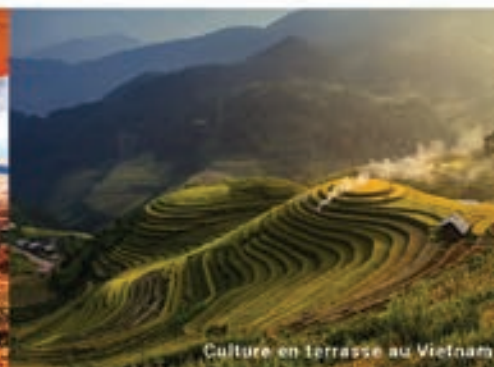
Culture en terrasse au Vietnam

7 AGENCES DE VOYAGES POUR TOUTES VOS ENVIES D'ÉVASION